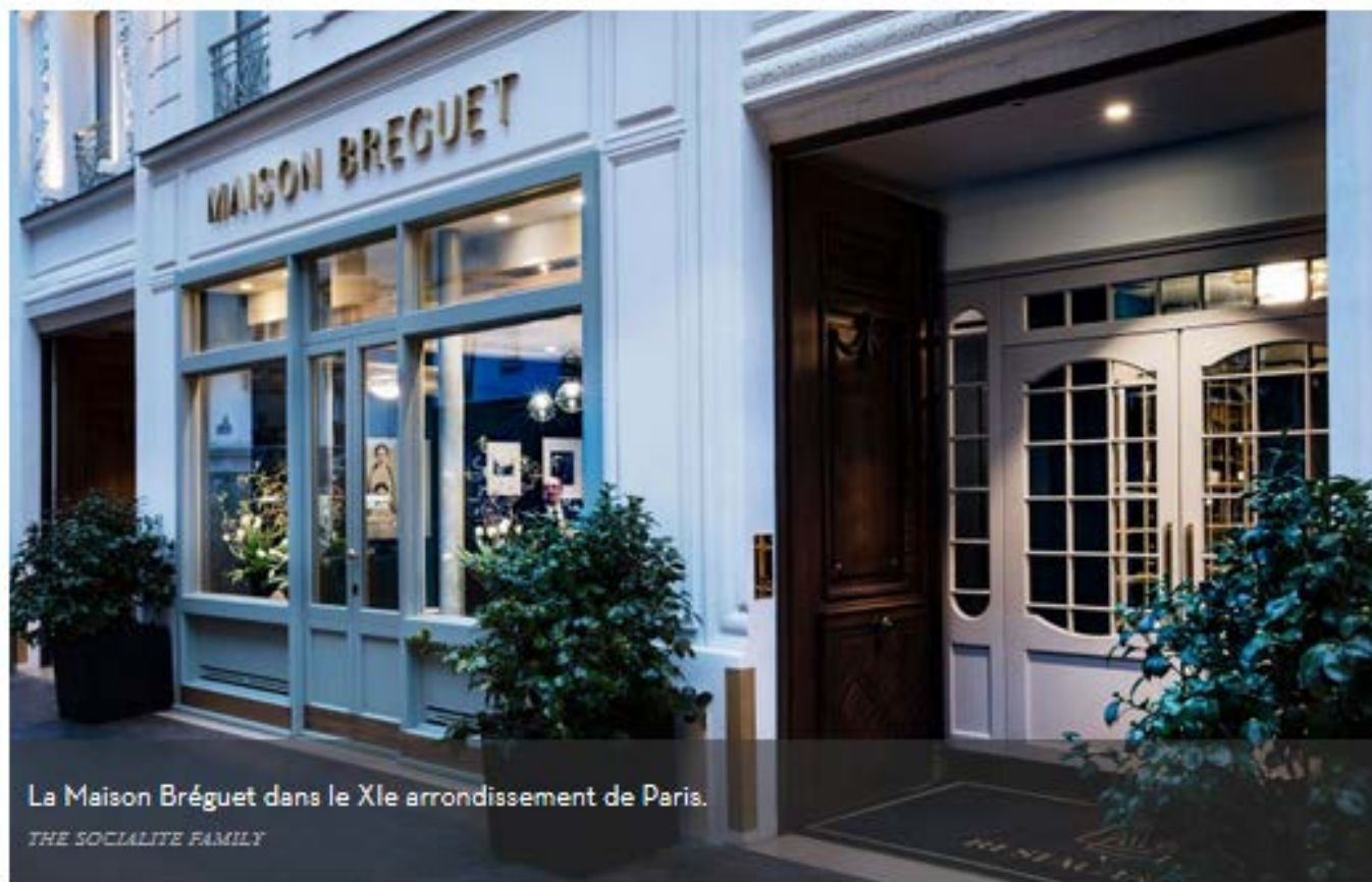
La Maison Bréguet dans le XI e arrondissement de Paris.

A près trois ans de travaux, l'immeuble qui abritait autrefois une fabrique de linge observe dans ses 53 chambres un souci du détail « maison » porté par Sagrada , un studio de design londonien. Voici un hôtel qui, en multipliant les collab', inscrit le lieu dans un entre-soi créatif, de la play-list sur mesure à la boutique d'objets stylés en passant par le catalogue de films cultes.